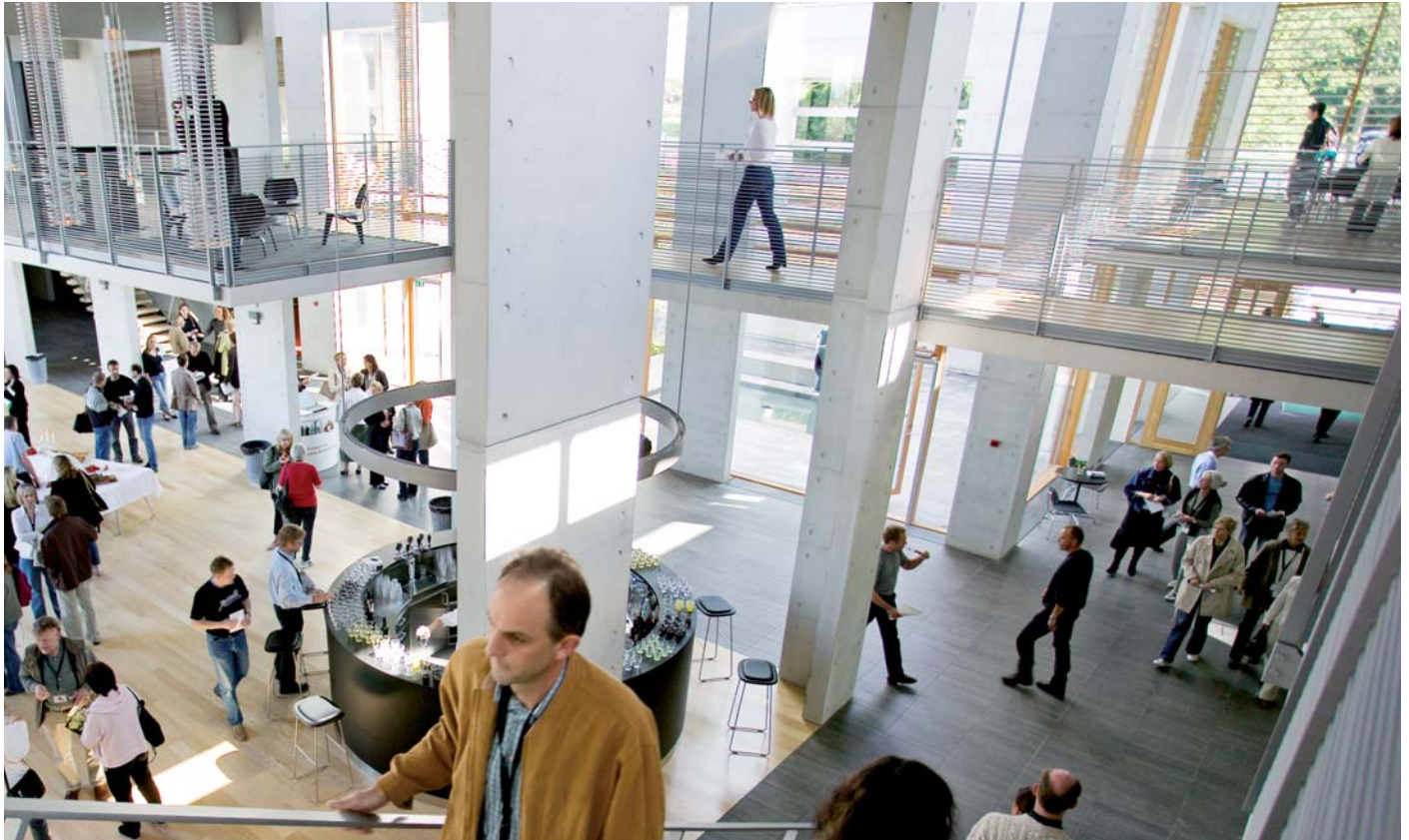
Søhuset er samlingsstedet for forskerparkens mange virksomheder

Alle virksomheder i forskerparken kan tegne medlemskab af Søhuset, der er hele Scion DTUs konference- og aktivitetscenter. Søhuset disponerer over eksklusive mødelokaler, auditorium, restaurant og café og motionscenter. Medlemskabet koster kr. 1.405,- om året pr. fuldtidsmedarbejder. Søhuset danner ramme om modtagelse af både danske og udenlandske gæster til forskerparken, og der afholdes ligeledes mange fagrelaterede arrangementer. ■